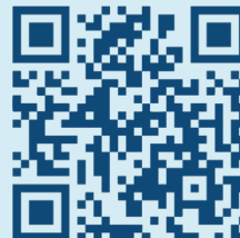
Vidéo historique 55 ans de l'OMHQ